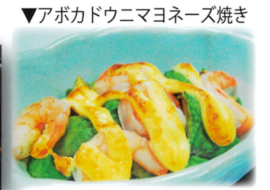
▼アボカドウニマヨネーズ焼き