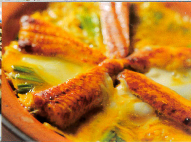
▲鰻とニラの玉子とじ